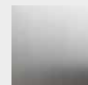
4 MM MASSIEF MAT GEBORSTELD